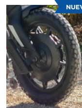
Neumático de tacos